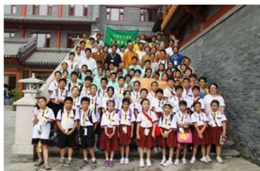
中小學生台灣夏令營

期盼透過此次活動可以讓每個中小學生在台灣豐富的山水美景中，尽情徜徉、紓解身心，得到充分休憩的心靈，在未來的知識殿堂上加倍冲刺，也希望讓參與的學子獲得多方位的全新成長經驗。