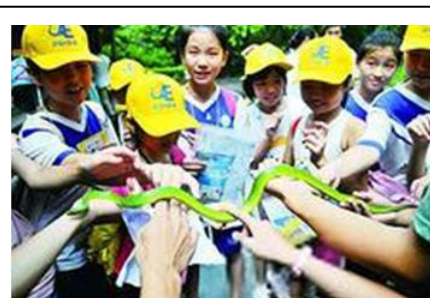
中小學生台灣夏令營聯誼